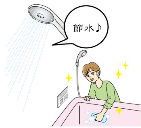
最新の設備にすることで、節水などの省エネや掃除がしやすくなるといったメリットも。