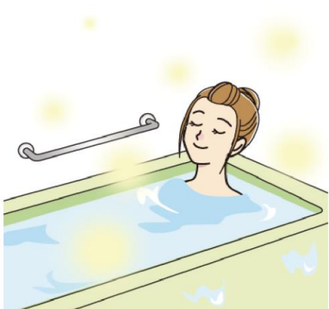
新しい浴室で快適さをアップデートするのも良いですね！

を解消したい、デザインを一新したい、新たな設備や機能を追加したいなど、リフォームの優先順位を考えておくと、相談がスムーズです。また、機能やオプションを追加すると費用は高くなるため、優先順位を考慮することは、工事内容を絞りやすくすることにもつながります。