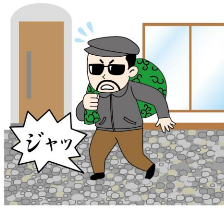
歩くとき大きな音をする防犯砂利というものもあります！建物の周辺に敷くと効果的です。

ことも手です。わずかなすき間にパールを入れてドアをこじ開ける手荒なやり口もあるので、鍵付きのデッドボルト（カンヌキ）タイプの鍵への交換もおすすめ。最新のドアは不正解錠しづらい構造のシリンドアや、鍵付きデッドボルトを採用したタイプもあるので、相談してはいかがでしょうか？ 窓も対策が必要。洗面所やトイレなど、小窓でも換気以外は施錠を。リビング以外の部屋の窓、特に2階の