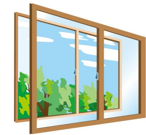
内窓の設置もおすすめ。窓を開けるのに時間を要します。

ことも手です。わずかなすき間にパールを入れてドアをこじ開ける手荒なやり口もあるので、鍵付きのデッドボルト（カンヌキ）タイプの鍵への交換もおすすめ。最新のドアは不正解錠しづらい構造のシリンドアや、鍵付きデッドボルトを採用したタイプもあるので、相談してはいかがでしょうか？ 窓も対策が必要。洗面所やトイレなど、小窓でも換気以外は施錠を。リビング以外の部屋の窓、特に2階の