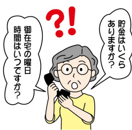
電話などで在宅状況や家族の状況、資産状況を聞かれてもむやみに答えないようにしましょう。

強盗は宅配業者や公共業者を装うなど巧妙化。対応する際には、必ずインターホンで事前確認を。また、水道の確認をさせていただきます」というケースも。公共機関の業者には警戒感も薄くなりがち。そのような心理を巧みに利用してきます。そもそも